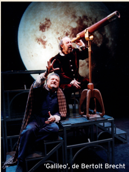
'Galileo', de Bertolt Brecht

L'OM-Imprebís és una companyia teatral espanyola amb una llarga trajectòria, que ha posat en escena un ampli repertori que abasta des dels grans textos de la dramaturgia universal ( Galileo , de Brecht ; Quijote , de Cervantes ; Calígula , de Camus , o Tío Vania , de Chéjov ) fins a espectacles com Els millors sketches de Monty Python o Imprebís , que, estrenat en 1994, es va convertir en l'espectacle d'improvisació pioner a Espanya.