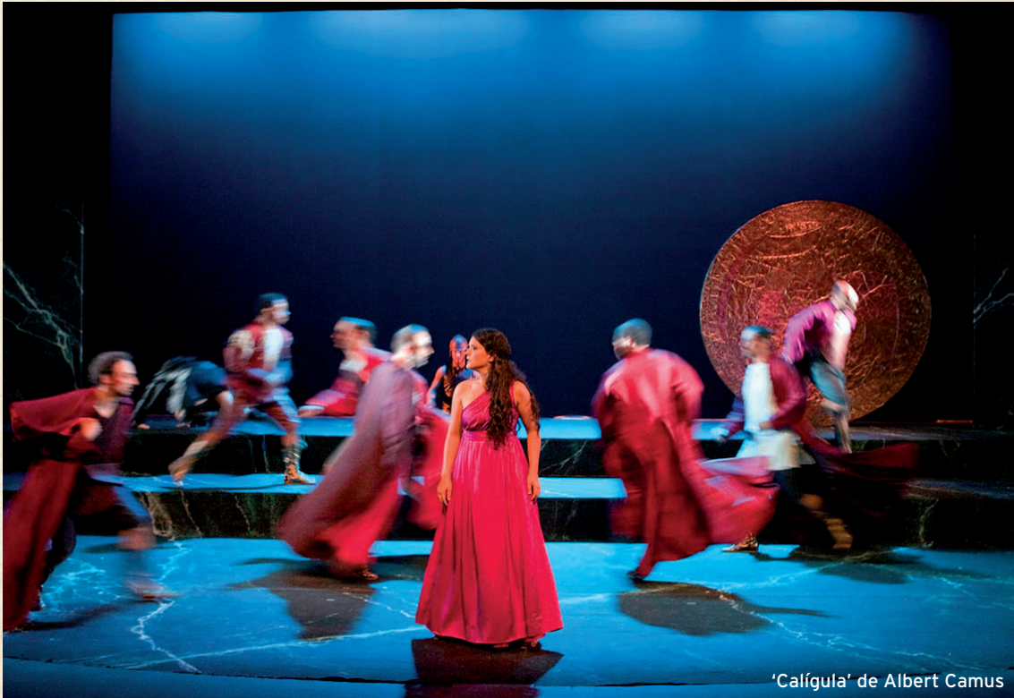
'Calígula' de Albert Camus