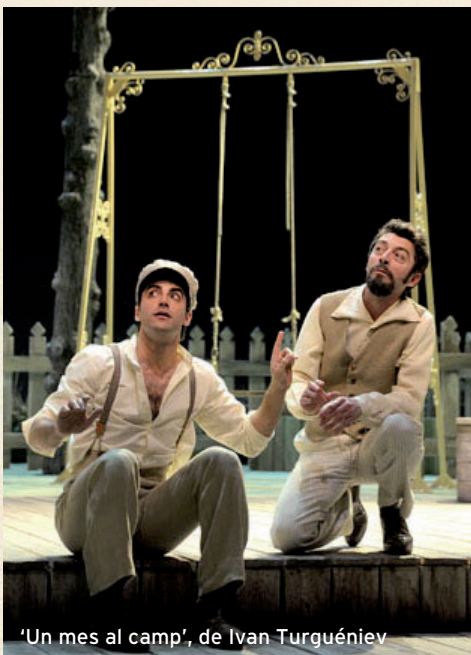
'Un mes al camp', de Ivan Turguéniev

Actor i director de referència en el teatre valencià de les últimes dècades.